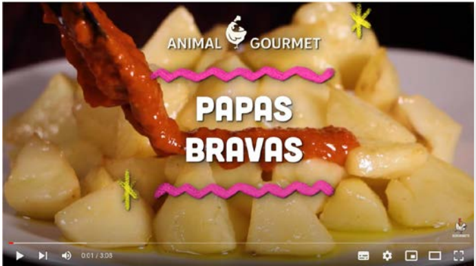
Videos - Web Series