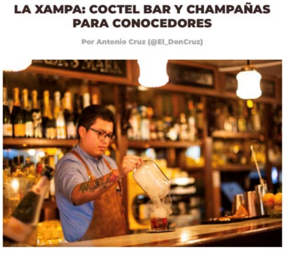
Nota patrocinada y Aliados Gourmet