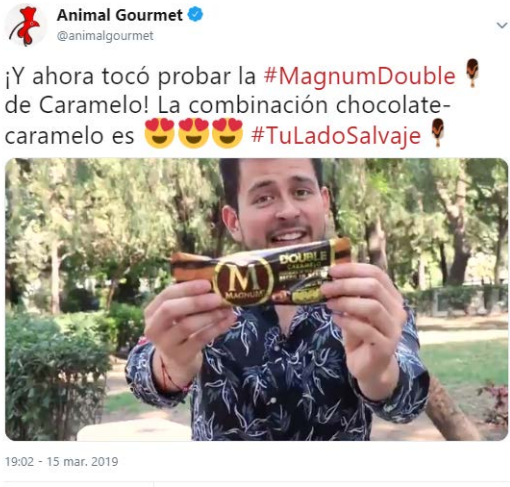
Activaciones en Redes Sociales