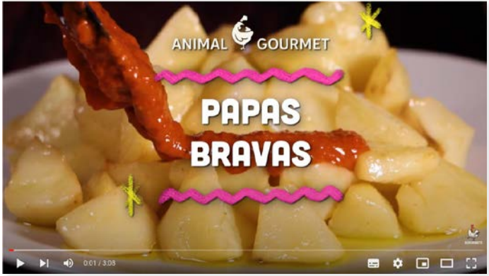
Videos - Web Series