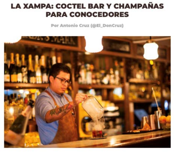
Nota patrocinada y Aliados Gourmet