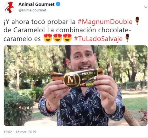
Activaciones en Redes Sociales