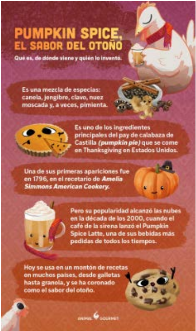
Infografías - Galerías