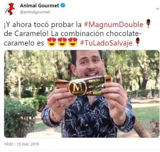
Activaciones en Redes Sociales